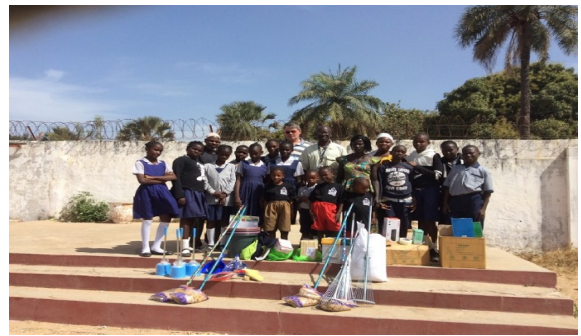
Kotu Preparatory School

In november zijn de daken van drie leslokalen en van het verblijf van het onderwijzend personeel